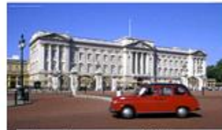
Τα ανάκτορα του Μπάκιγχαμ