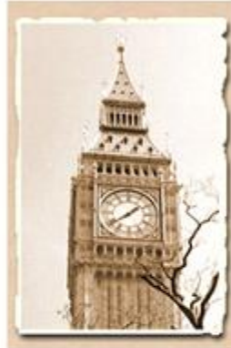
Το Μπιγκ Μπεν